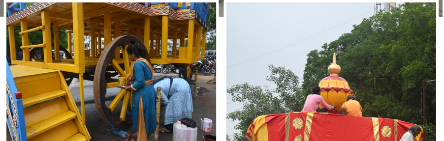
અપાઠી બીજની પવિત્ર તિથીએ એટલે કે ૨૭મીએ ઈસ્કોન મંદિરથી ભગવાન જગન્નાથની ભવ્ય રથયાત્રા નીકળશે. આ વર્ષે રથયાત્રા સાદગીથી કાઢવાનો નિર્ણય લેવાયો છે. જેને પગલે ડીજે કે અન્ય સાઈન્ડ સિસ્ટમ વગાડવામાં નહીં આવે પણ પારંપરીક વાજુત્રીથી ભગવાનના ભજન ગવાશે.